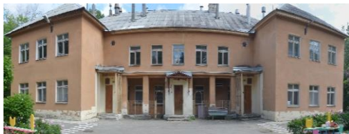
дошкольное отделение МБОУ СОШ №32